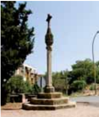
Creu de Terme

Al costat mateix del pont hi ha la creu de Terme. La base, de mitjan segle XVII, és escalada i té forma octogonal. El pom és una peça pla-terresca ornada amb vuit capelles que contenen imatges molt desgastades. El nus gòtic conté l'escut de l'abat Porta.