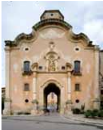
Porta de l'Assumpta

patrona dels monestirs cistercencs. Al damunt, la divisa de l'abadia, la doble creu. Des de la barana frontal podem contemplar una magnífica vista de la vall del riu Gaïà i l'Albereda. Aquesta plaça formava part del primer recinte monàstic i, a més de la capella i la vicaria, acollia la quadra, la ferreria i els estables i magatzems on es guardaven el bestiar i els estris del camp. De la plaça sortim per la porta de l'antiga porteria, girem a mà dreta i pel sender del costat de la Font de la Cuixa arribem a la carretera de les Pobles, on trobem la tanca que envolta la cara nord del monestir. Aquesta n'és la cara més freda. Les pedres estan enfosquides per la humitat i desgastades pel refrec dels vents de tramuntana. La primera cosa que ens crida l'atenció és la torre de l'Homenatge. Va ser construïda a la fi del segle XIV, just en acabar les obres de l'església. Més amunt, a la part alta de la paret del creuer, hi descobrim encastada una làpida amb escuts. Diu la llegenda que podria ser la tomba del mestre d'obres que morí allí en caure de la bastida. Al final de la tanca que envolta el monestir comença el camí dels Hortets.