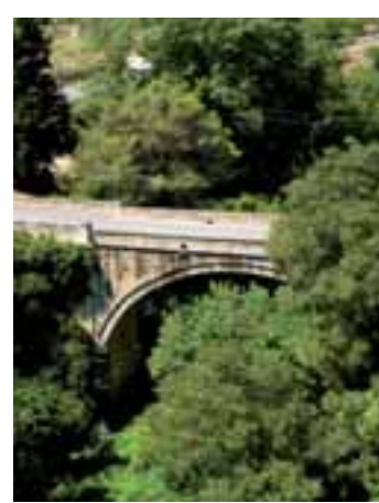
Pont de Pedra