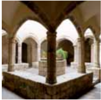
Pati palau de l'abat

Bernat Calbó fou un dels grans abats de Santes Creus. Ell va ser qui va acomiadar el rei Jaume I i les seves hosts aquí a Santes Creus, de camí a la conquesta de Mallorca, el 1229.