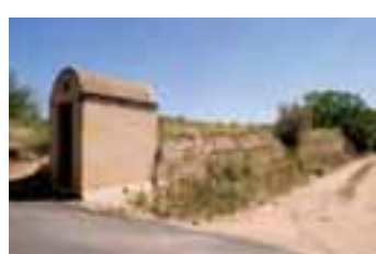
Distribuidor de les aigües amb la mina i el fons del bosc de Sant Sebastià

A uns cinquanta metres a l'esquerra, una caseta acull l'antic distribuïdor d'aigües del monestir. Més enllà, a un costat del camí, uns hortets amb verdures i arbres fruiters. A l'altre, al final de la tanca, la façana de migjorn del monestir. Una vista que no reflecteix exactament la noblesa de les estances i els racons de l'interior de l'edifici. Hi veiem, seguidament, la torre de l'Homenatge i la façana del Palau Reial, la façana del refetor nou, amb el finestral gòtic, les restes de l'antiga cuina i la nova recepció. Seguint el camí, més avall, creuem la rasa dels hortets. Aquesta rasa recollia les aigües d'antigues fontetes que amb els anys han desaparegut. Passada la rasa, un canyar ens acompanya fins a trobar un mur merletat de tàpia mig enderrocat. És un mur que encerclava les vinyes del monestir. Aquesta vinya rep el nom de vinya Closa. El camí segueix per la urbanització Els Manantials , el torrent d'en Rubió, la carretera d'Aiguamúrcia i el molí de Baix, on acaba.