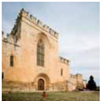
Façana de l'església

Abans, a mà dreta, hi trobem el racó conegut com a Joc de Pilota , on els novics jugaven durant les hores d'esbarjo. L'església és de quatre naus i de perfecta creu llatina. El transsepte i la nau central tenen cobertes a dues aigües; les dues naus laterals, més baixetes, aporten aigües a nord i a sud. El frontis, sobri i auster, és molt elegant. Cal ressenyar les fortificacions, amb els seus merlets i les espitlleres acabades pels volts del 1378. La porta és de punt rodó amb motlures gòtiques; hi predominen els elements decoratius de tipus vegetal. A banda i banda de la porta, dos arcs amb escuts, que podrien ser les tanques de dues urnes funeràries. El gran finestral del frontis, de mitjan segle XIII, conserva molts vitralls originals.