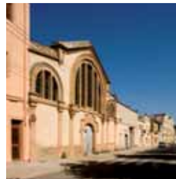
Cooperativa agrícola de Cèsar Martinell

Des de l'Albereda per la carretera i el carrer de Pau Casals, anem cap al pont de Pedra. A mig recorregut, a l'esquerra hi ha l'antiga cooperativa agrícola. És una obra de Cèsar Martinell, construïda l'any 1923, avui en desús. El pont de Pedra està bastit en un punt estratègicament important, ja que enllaça tres camins que a la vegada comuniquen sis comarques. El pont fou construït l'any 1549 en temps de l'abat Jaume Valls. Les dades estan gravades en lletres gòtiques en un dels pilars. És tracta d'un pont d'un sol ull, fet amb bons carreus de pedra i amb una bona boca per evitar embussos en anys de fortes riuedes.