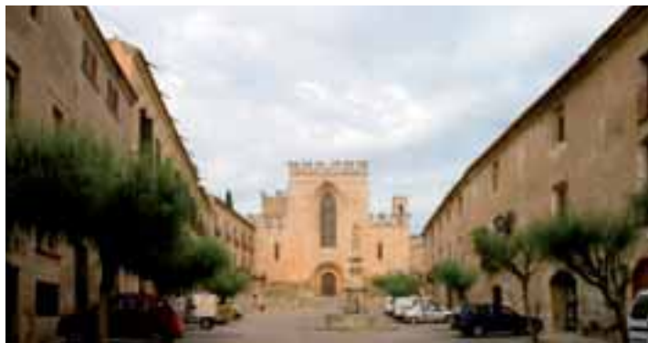
Plaça Sant Bernat, l'església al fons

De l'antic hospital de Sant Pere, se'n conserva el pati porticat d'entrada, amb pilars i arcades lleugerament apuntades propies del segle XIII. A mitjan segle XVI l'edifici es destinà a Palau Abacial. Avui pertany a l'Ajuntament d'Aiguamúrcia. Abans de sortir de la plaça us convidem a girar-vos i tornar a contemplar el magnífic conjunt. Els esgrafiatos de les cases, la font del mig, l'escalinata del fons, la sòbria façana de l'església, entre la torre de les Hores i la torre de l'Homenatge, formen un conjunt del tot remarcable.