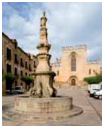
Font de Sant Bernat

Tot baixant les escales i observant la plaça de Sant Bernat, ens preguntem qui hi vivia i quina utilitat tenien aquestes cases. El funcionament monàstic requeria tot un conjunt d'equipaments i molts estaven a la plaça. Al primer pis, a les cases que veiem a mà dreta, hi vivien els monjos jubilats, el metge, l'apotecari i els seus criats. A la planta baixa, els magatzems. A l'altre cantó, a mà esquerra, la bosseria, l'hospital de Sant Pere, la farmàcia i diverses dependències per a altres usos de la comunitat.