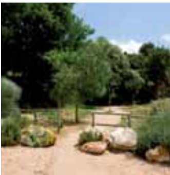
Font del Camp

Reprenem la carretera de les Pobles. A uns 100 metres hi ha la font del Camp, l'aigua de la qual es recull en una bassa que antigament servia per regar l'hort del camp dels Avellaners i l'hort del camp dels Noguers. Actualment aquests horts estan urbanitzats.