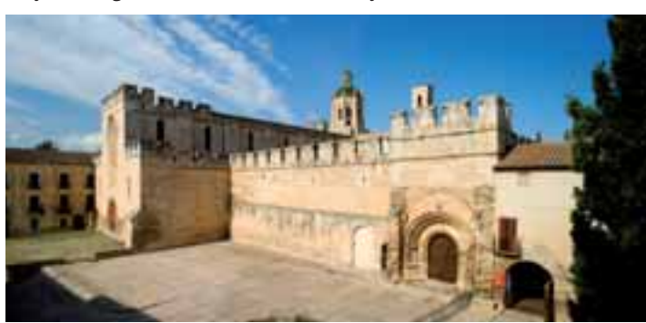
Joc de Pilota

Abans, a mà dreta, hi trobem el racó conegut com a Joc de Pilota , on els novics jugaven durant les hores d'esbarjo. L'església és de quatre naus i de perfecta creu llatina. El transsepte i la nau central tenen cobertes a dues aigües; les dues naus laterals, més baixetes, aporten aigües a nord i a sud. El frontis, sobri i auster, és molt elegant. Cal ressenyar les fortificacions, amb els seus merlets i les espitlleres acabades pels volts del 1378. La porta és de punt rodó amb motlures gòtiques; hi predominen els elements decoratius de tipus vegetal. A banda i banda de la porta, dos arcs amb escuts, que podrien ser les tanques de dues urnes funeràries. El gran finestral del frontis, de mitjan segle XIII, conserva molts vitralls originals.