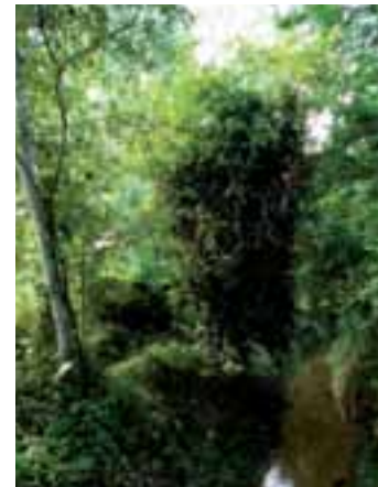
Racons de verd i aigua

Arribant de nou a Santes Creus, trobem uns camins a mà esquerra que baixen a l'Albereda. Aquesta té una extensió aproximada de 9 ha i està situada al marge esquerre del riu Gaïà.