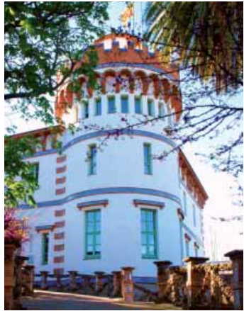
Torre d'en Reig

Si continuem pel carrer dels Comuners de Castella arribarem a la Torre d'en Reig, un edifici de finals del segle XIX, principis del XX, d'estil modernista, construït per encàrrec de Josep Reig i Palau, fill de Vilabertran i enginyer forestal encarregat de fixar les dunes d'Empúries. Podem accedir als jardins per l'entrada principal i sortir-ne per l'accés lateral, per tal de tenir una visió més completa de l'edifici.