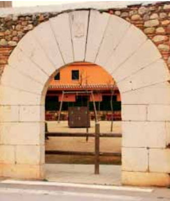
Carrer de Vilatenim

Des de la plaça, agafant el carrer del Príncep de Bergara i fent un petit revolt al carrer de l'Abat Rigau, arribem al carrer de Vilatenim i trobem un altre portal adovellat que dona accés a una zona d'esbarjo. A la dovella central hi veiem un escut amb un sautor i la inscripció 1588. Ara reculem pel carrer de l'Abat Rigau fins a trencar a l'esquerra pel carrer de Pep Ventura i arribem fins una plaça, la plaça del Doctor Heras, on