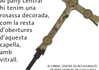
Creu de Vilabertran

Si voltéssim l'església per la banda nord, veuríem els exteriors de la capella gòtica que els vescomtes de Rocabertí, senyors de Peralada, van fer construir al segle XIV al braç nord del transsepte de l'església, i que actualment és marc d'exposició de la Creu de Vilabertran, una obra d'argenteria única a Catalunya. Aquí les finestres són molt més grosses i esveltes, geminades amb arc apuntat i coronades per una roseta. Al pany central hi tenim una rosassa decorada, com la resta d'obertures d'aquesta capella, amb vitrall.