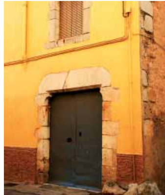
Carrer dels Comuners de Castella

podem contemplar un altre portal adovellat i una finestra geminada amb arquets de forma trilobulada i decoració floral, com les finestres de la façana sud del palau abacial. Finalment, si enfilem a la dreta el carrer de l'Empordà i tombem a l'esquerra, al carrer dels Comuners de Castella trobem una casa amb un portal de carreus i una finestra amb les mateixes característiques que l'anterior.