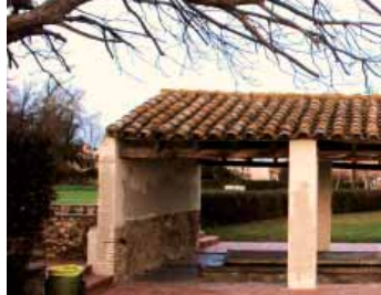
Font de l'abat Rigau i Safareig

La Torre d'en Reig, amb elements que emulen la natura i amb reminiscències de fortificació medieval, té moltes semblances amb la casa forestal de Sant Martí d'Empúries. Consta de planta baixa, dos pisos, golfes i una torre. Els mobles havien estat dissenyats especialment per a l'edifici seguint l'estil modernista.