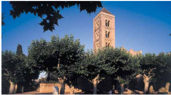
Exterior de l'església