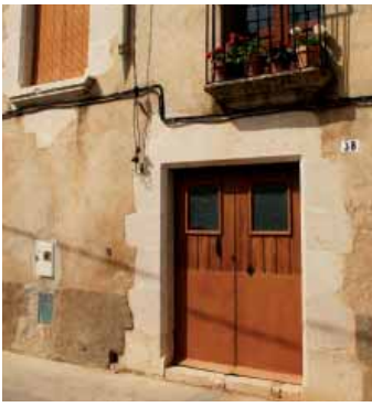
Carrer de Santa Maria