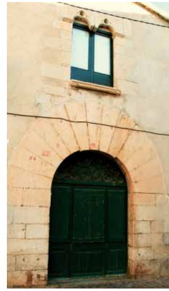
Plaça del Doctor Heras