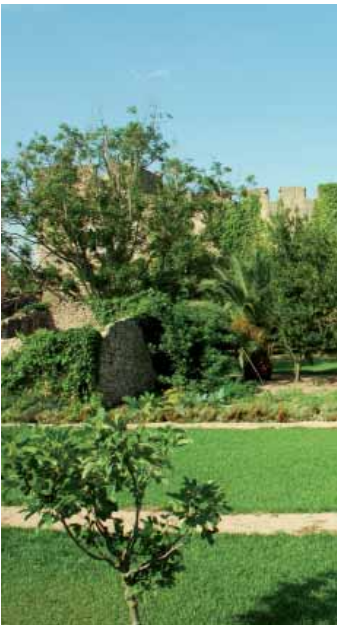
Hort del Prior