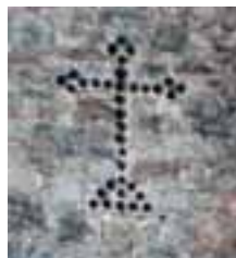
La cruz que señala el lugar donde las tropas franco-españolas del teniente general conde de Muret abrieron brecha durante el sitio de 1711.

fortificación al ser la entrada al recinto fortificado. De hecho, éste fue el único punto de las defensas del castillo por donde las tropas franco-españolas del conde Muret consiguieron abrir brecha en el transcurso del sitio de 1711. Una cruz, construida con balas de cañón y situada en el flanco del baluarte, recuerda este hecho.